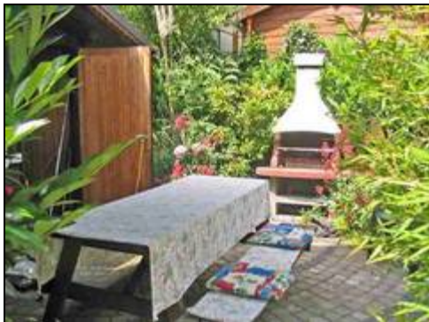
Gartenterrasse mit Grill